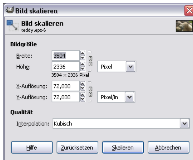
Abbildung 1.1: Dialog zur Dateneingabe beim Skalieren eines Bildes

Sie haben erfolgreich Ihr erstes Bild skaliert, und werden nun ein paar Fragen haben. So zum Beispiel, woher das Programm wusste, wie hoch unser Fotorahmen ist. Nun, das