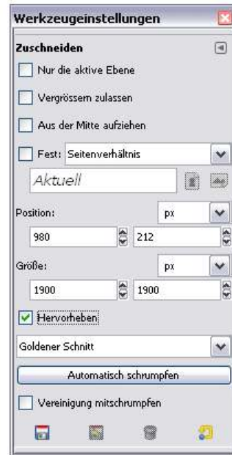
Abbildung 1.2: Links ist die Werkzeugkasten zu sehen, mit der darunter angedockten Dialogbox zur Dateneingabe beim Zuschneiden eines Bildes. Rechts ist dieselbe Dialogbox noch einmal dargestellt. Diese könnte ja auch frei auf dem Desktop platziert sein. Das Werkzeugsymbol (das Skalpell) für das Zuschneiden ist im Werkzeugkasten (linkes Bild) hervorgehoben und aktiv (in der zweiten Iconreihe von Oben, ganz rechts).